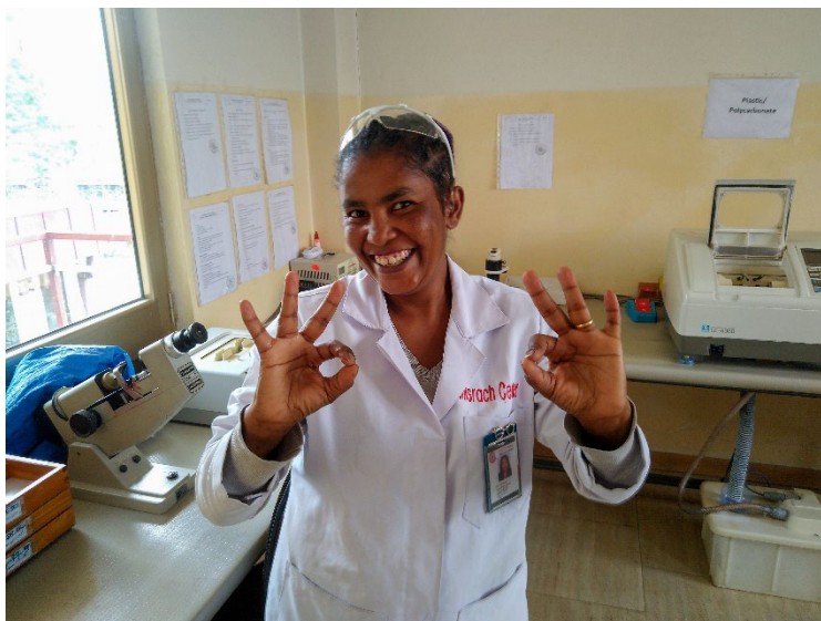
Im Misrach Center in Addis Abeba, Äthiopien versteht man auch die Gehörlosensprache.